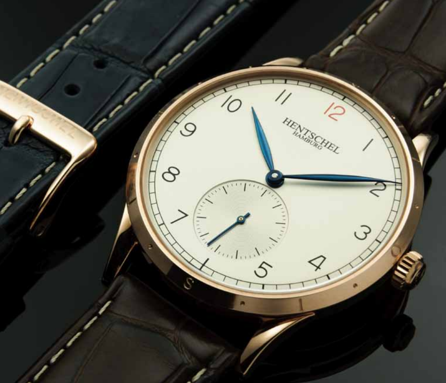
En detail: Das Gehäuse der „Seven Seas“ besteht aus veredelter Schiffsschrauben-Bronze, in dem ein Handaufzugswerk sitzt. In die Lünette sind die Himmelsrichtungen eingraviert. Zum Lieferumfang gehören zwei Lederarmbänder in Blau und Braun.

macher einen direkten Kontakt mit dem Kunden und kreieren für ihn sein ganz persönliches Produkt.